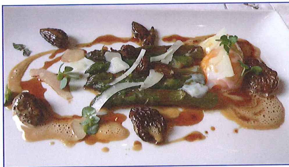
Oeuf parfait, asperges et morilles

Autant dire que cela fuse et ruse, avec de belles moments azuréens: ainsi le plaisant risotto façon paella aux coquillages et chorizo avec son émulsion au jus de moules et sa salade d'herbes, la fraîche dorade royale marinée au citron vert avec son guacamole au piment d'Espelette, l'oeuf parfait, dont c'est la mode ces temps ci un peu partout (on l'a vu récemment au Maximilien de Zellenberg) avec sa fricassée d'asperges et son crémeux aux morilles plus des copeaux de parmesan, les gambas en variation, au bouillon au gingembre et à la citronnelle, l'une snackée, l'autre en raviole, la riche (un peu trop!) viennoise de maigre en croûte de moutarde avec ses légumes verts cuit au bouillon et son émulsion de petits pois.