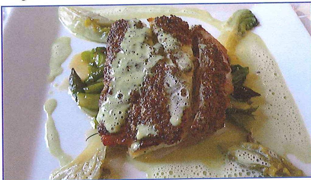
Viennoise de maigre en croûte de moutarde