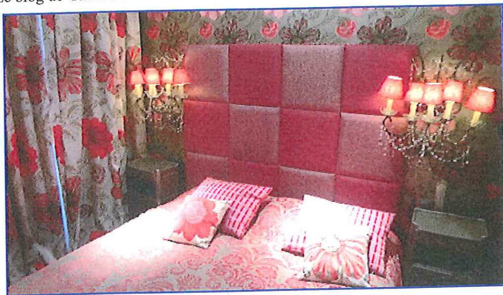
Une chambre

Le Clos des Délices, 17, rte de Klingenthal, 67530 Ottrott. Tél. 03.88.95.81.00. Ch. et suites 112-350 €. Menus: 26 (végétarien), 29 (sf samedi soir), 44, 59, 69, 78 (vins c.) €. Carte: 65-85 €.