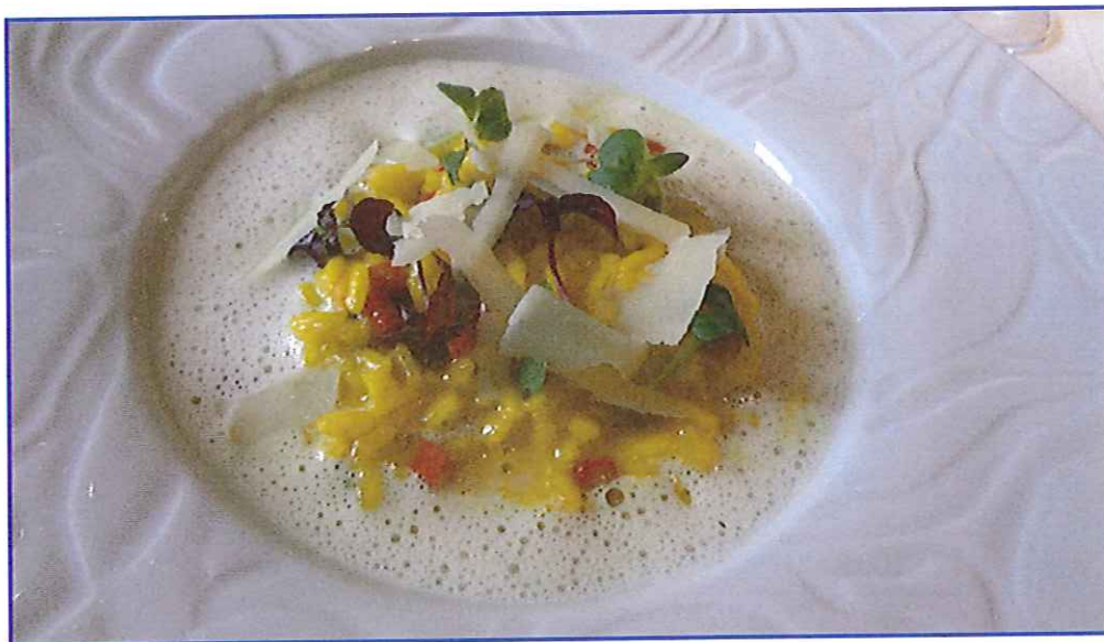
Risotto comme une paella

Jung au Croco strasbourgeois, mais aussi chez Richard Coutanceau à la Rochelle et au Domaine de Rochevillaine en Bretagne. Tous deux jouent l'air du temps, avec des idées d'ailleurs, de la Riviera, de la côte atlantique ou des îles.