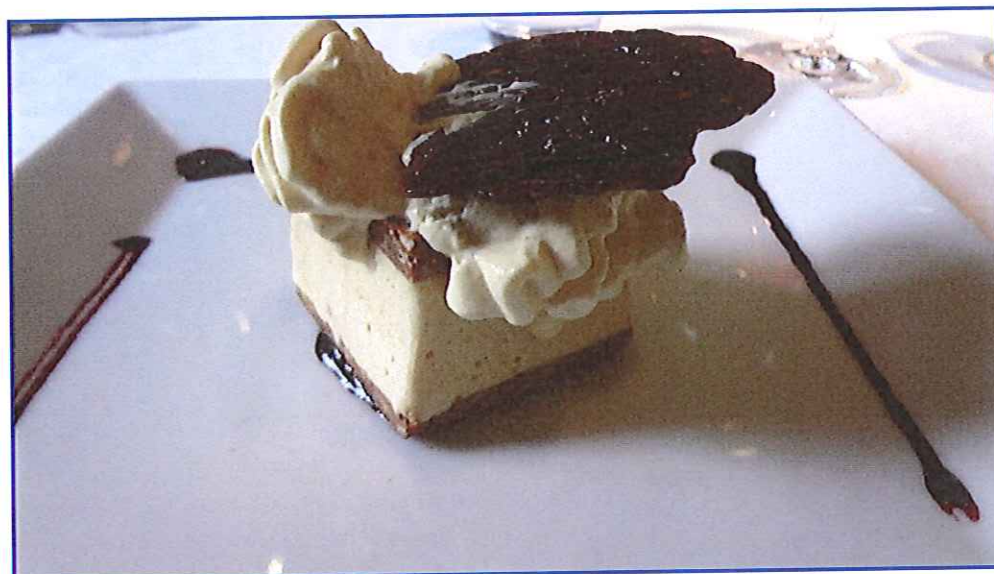
Parfait glacé au caramel, riz soufflé