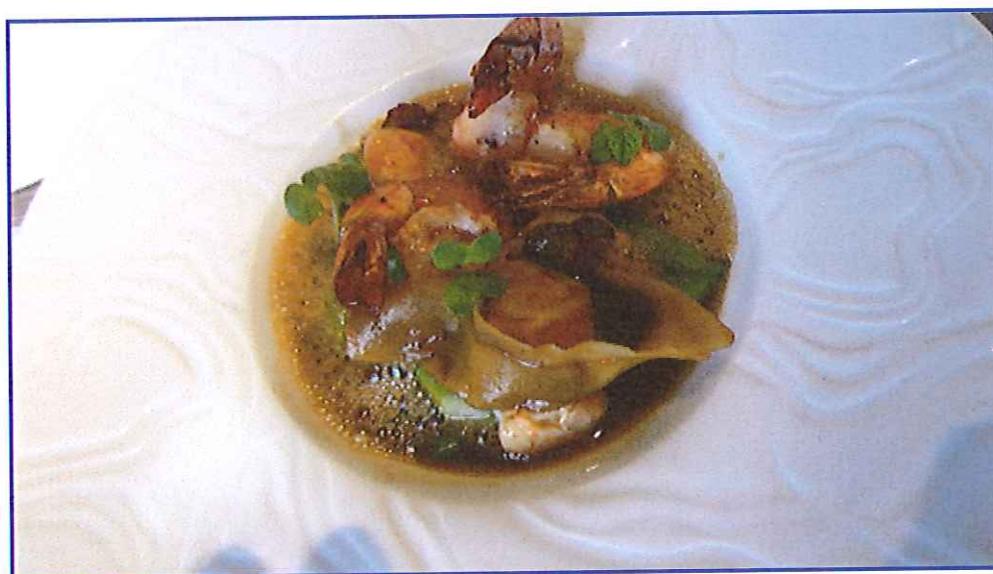
Gambas snackées et en raviole