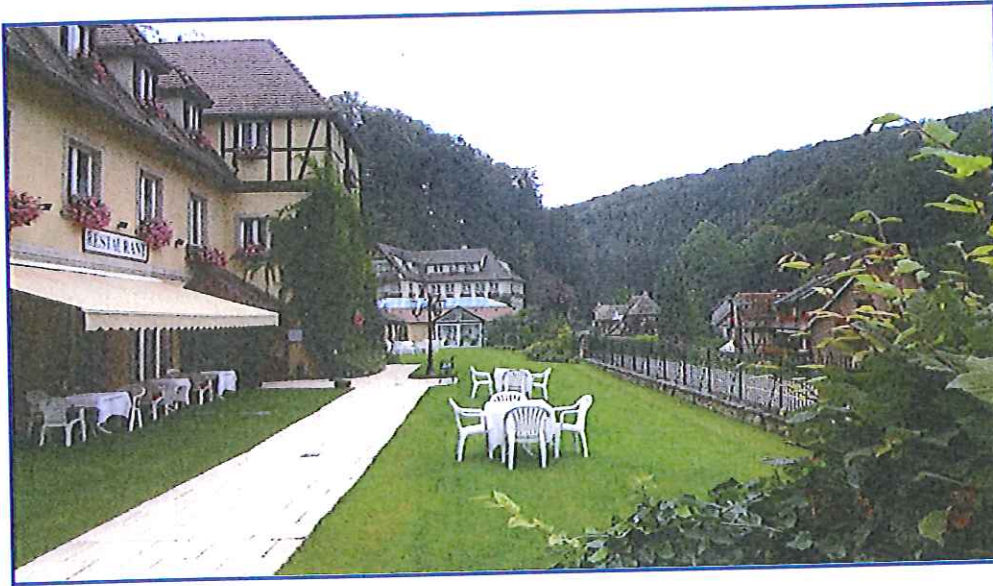
Le Clos des Délices

C'est un coin de luxe à Ottrott, sur la route de Klingenthal. C'est le Clos des Délices: une propriété intrigante, d'origine napoléonienne, avant de devenir un couvent de bénédictines, sur son bout de route bucolique et sylvestre, avec son parc de 6 ha, ses chambres sur-décorées, version néo 1960, baroques et colorées ou encore romantiques chics, son spa, sa piscine, sa belle table et sa cave imposante. Aux commandes: Désiré Schaetzel,